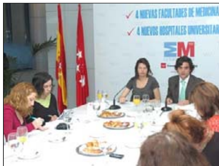
Periodistas y consejeros, durante el desayuno informativo.