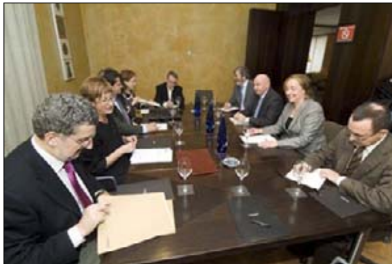
Las consejeras Noeno y Kutz encabezaron sus respectivas comitivas.

El acuerdo permitiría coordinar los recursos en Atención Primaria y en Atención Especializada. En este caso, el Hospital de Tudela y el Centro de Alta Resolución que se abrirá en Tarazona complementarían los servicios que pudieran prestar a la población de las zonas limítrofes de Aragón y Navarra.