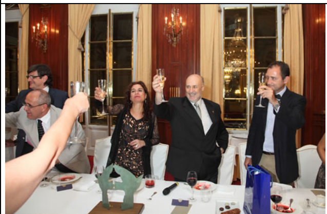
Brindis final de la premiada con los invitados