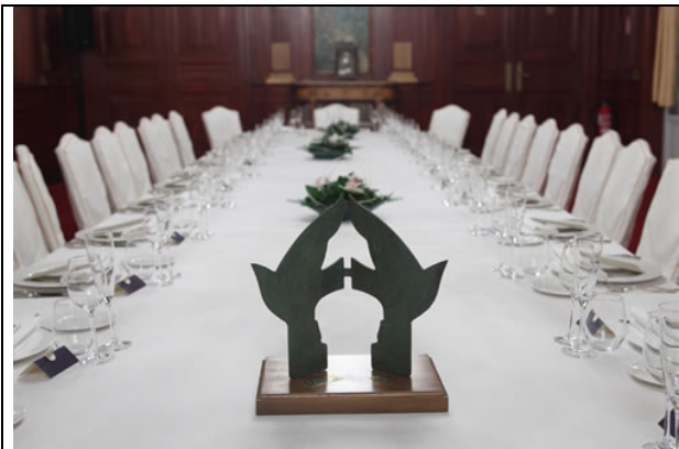
Imagen del "Premio Eupharlaw-IbercisaIud"