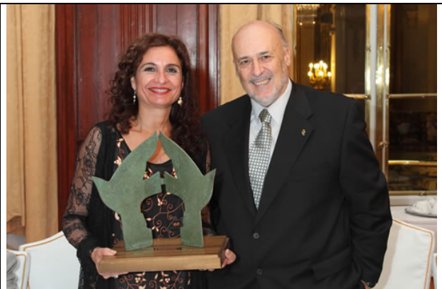
La Consejera con el Presidente de EupharlawIbercisaIud